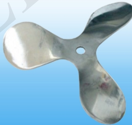
Hélice Marina 3 palas (acero inoxidable)