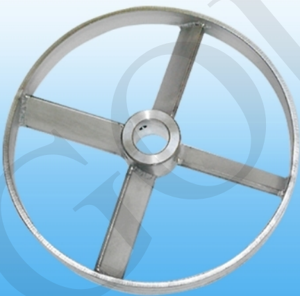
Hélice Turbina 4 palas (acero inoxidable)