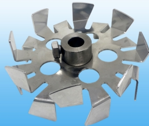
Hélice Cowler dispersora (acero inoxidable)